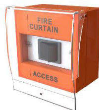
29186 לחצן גישת חירום (פעולת לחיצה והחזקה עבור שירותי חירום)