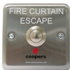
29197 לחצן מילוט חירום R

לחצני מילוט חירום (ERB) מאפשרים מעבר מילוט דרך וילון אש המצוי במצב פריסה. מנגנון 'לחיצה ושחרור' בלחצן ה-ERB משדר אות פיקוד לווילון האש לבצע גלילה מעלה (Retract) והשהיה, בטרם פריסה חוזרת. תהליך זה מתיר את מעבר השוהים דרך הפתח, בטרם סגירתו החוזרת של הווילון בתום השהיית זמן קצובה (Set time period).