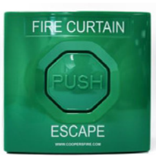
29174 לחצן מילוט חירום סטנדרטי