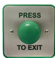
29181 לחצן מילוט חירום כיפה