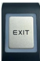
31019 לחצן מילוט חירום דלוקס