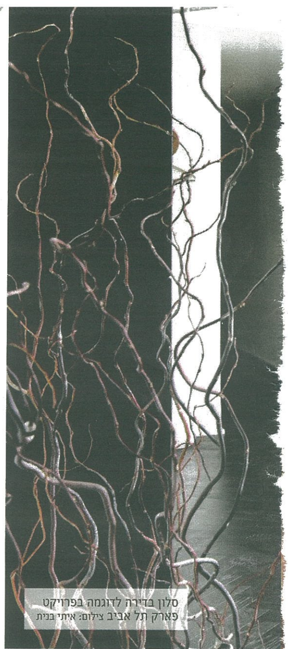
סלון בדירה לדוגמה בפרויקט פארק תל אביב

הקו העיצובי שנבחר: “היו לי שני קווים מנחים בעבודה על הדירה, שהם חלק מסגנון העבודה שלי: ראשית כל, אני לא מפחדת מצבע, ואני כבר עייפה מדירות של לבן על לבן על לבן. שנית, רציתי להראות שהדירה יכולה לעבוד בכל מיני סגנונות ולכן גם עשינו חדרים שונים